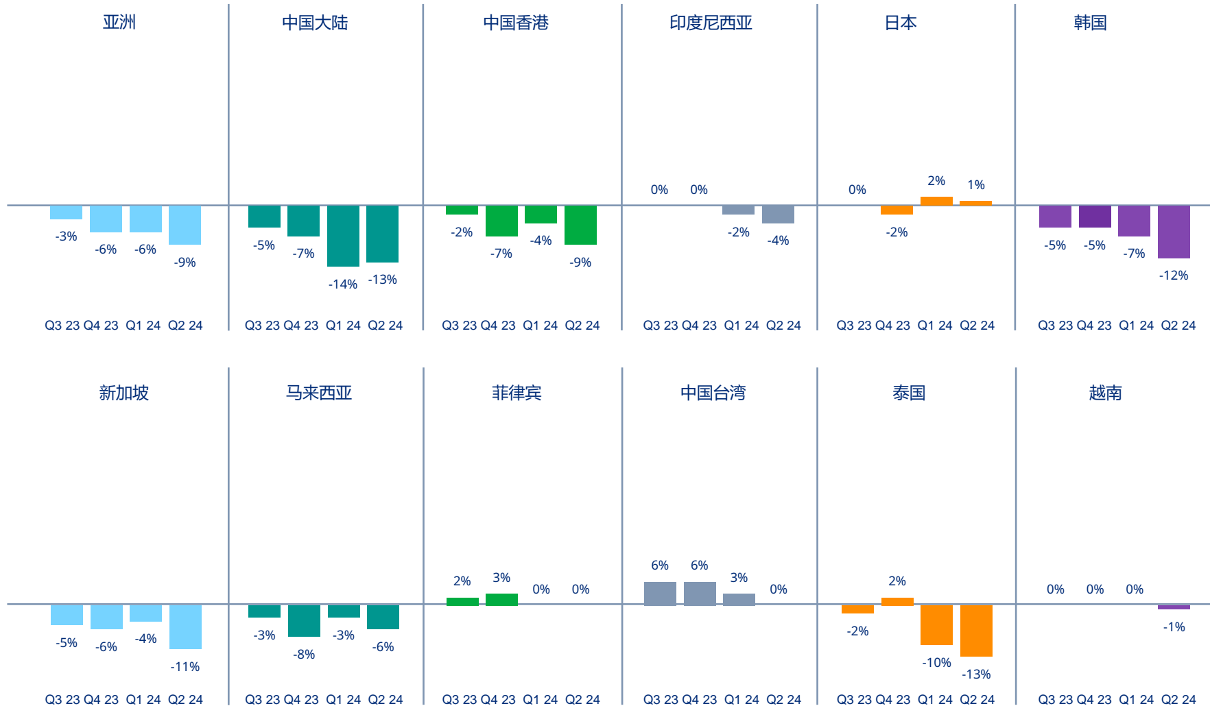
图表4| 亚洲各国/地区财务及专业责任险价格变动情况