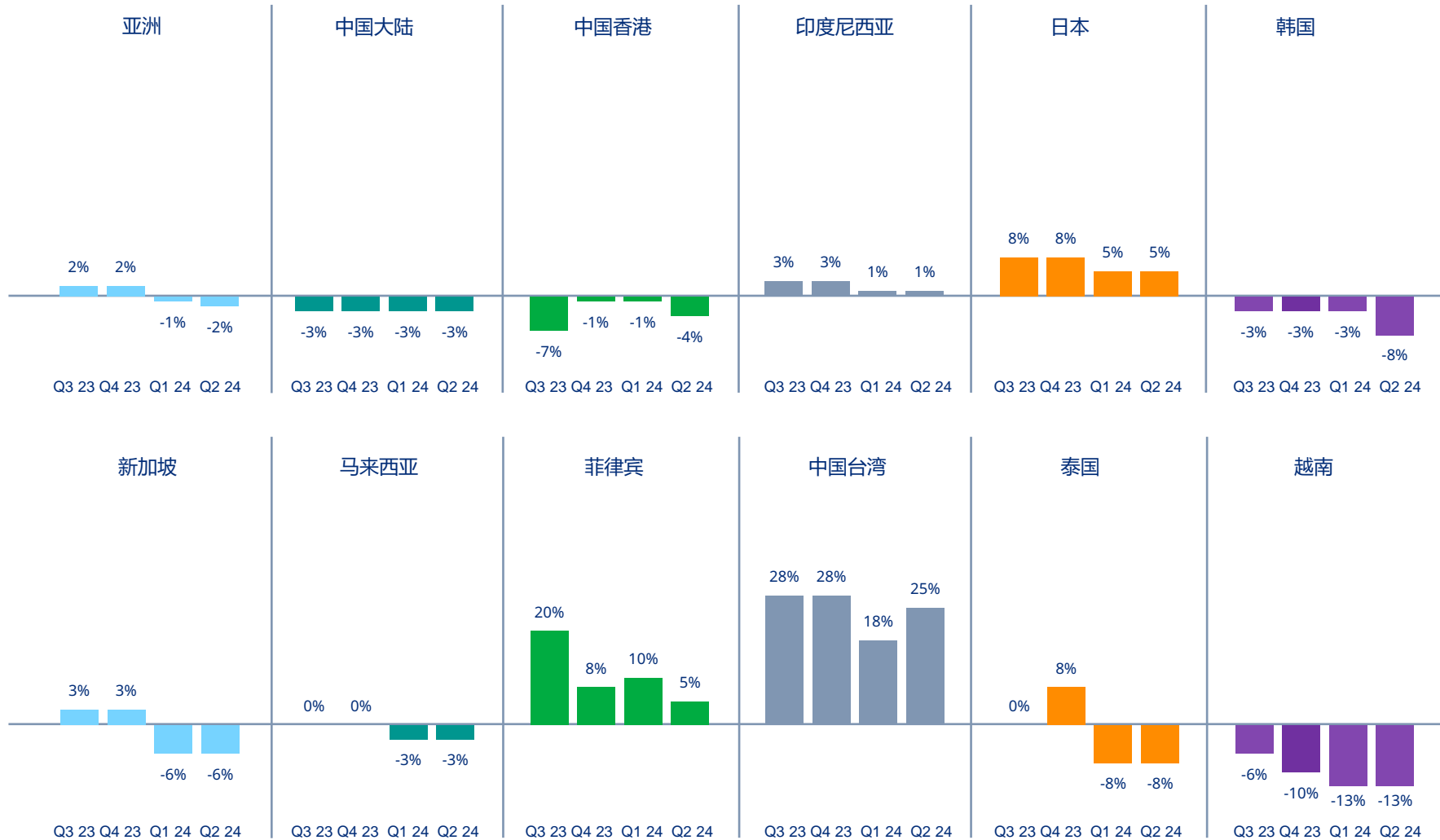
图表2| 亚洲各国/地区财产险价格变动情况