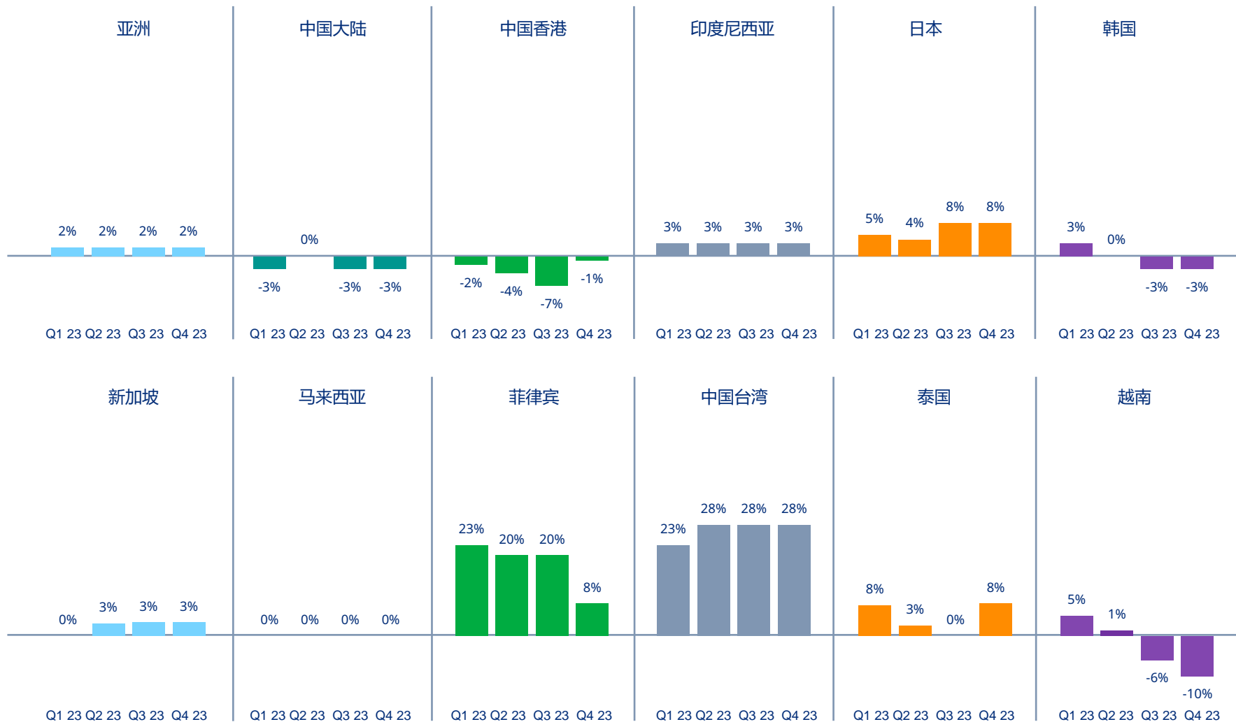
图表2| 亚洲各国/地区财产险价格变动情况