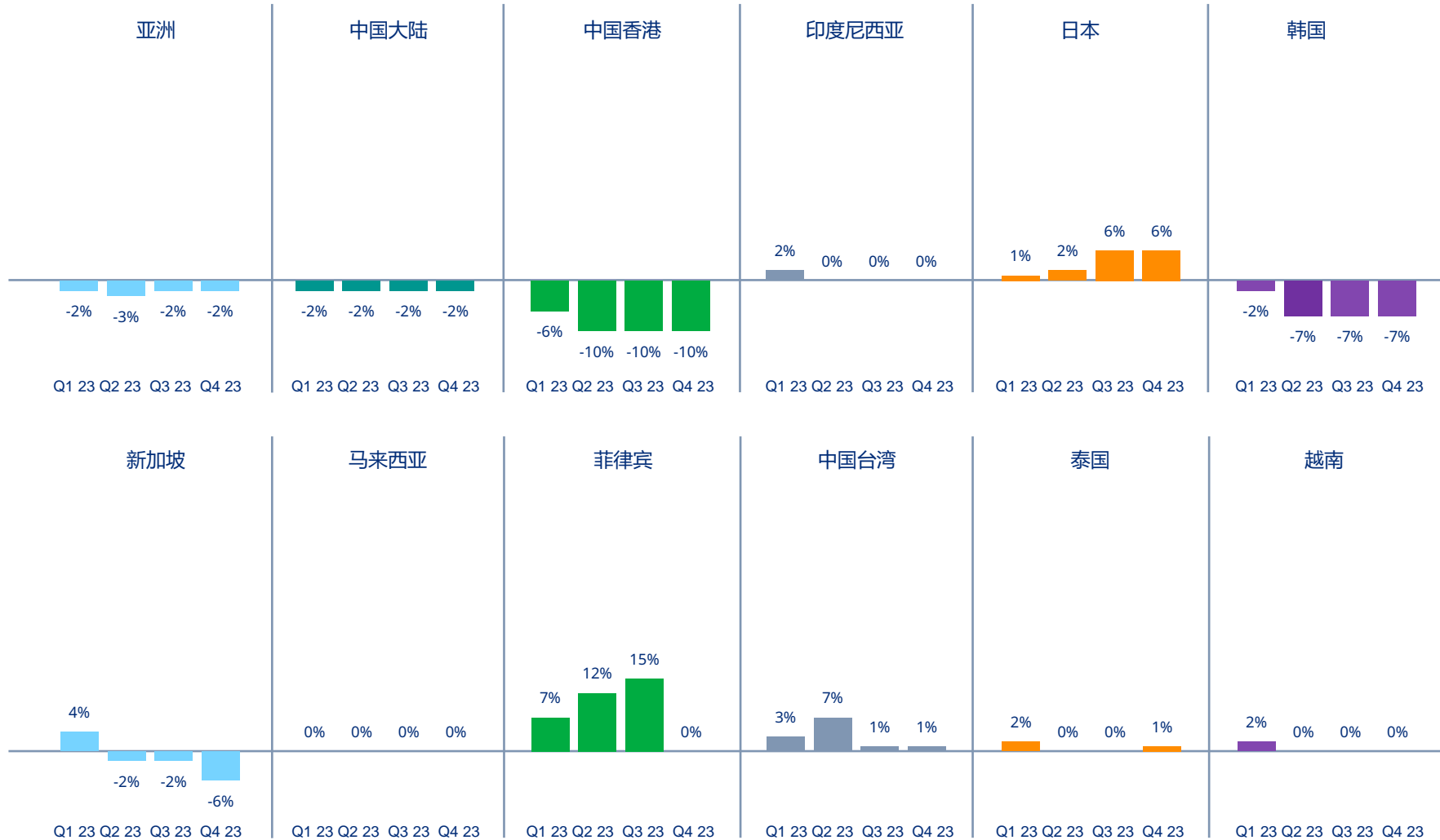
图表3| 亚洲各国/地区责任险价格变动情况