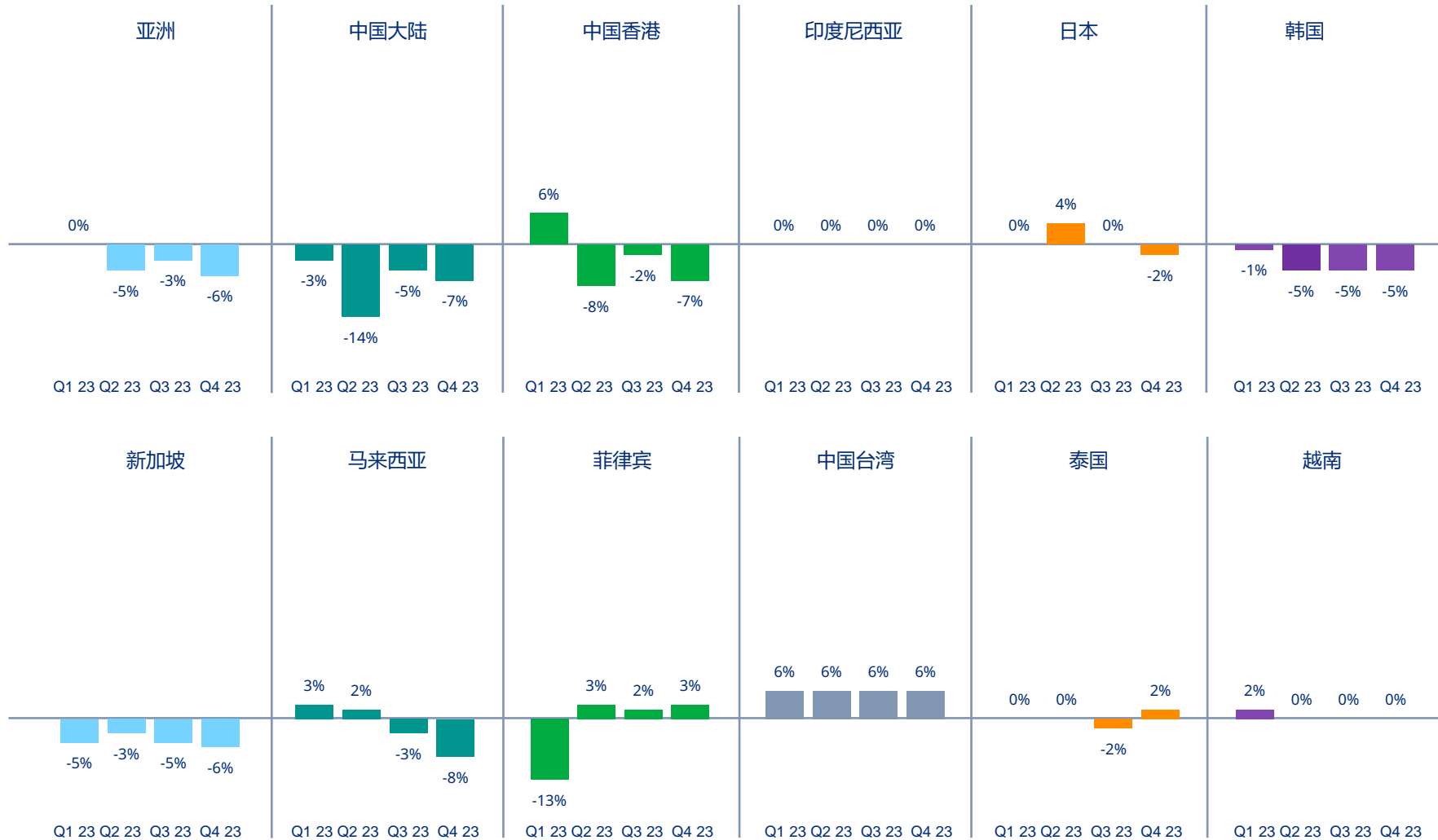
图表4| 亚洲各国/地区财务及专业责任险价格变动情况

亚洲财务及专业责任险的价格在本季度下跌了6%，跌幅进一步扩大（上一季度跌幅为3%）。